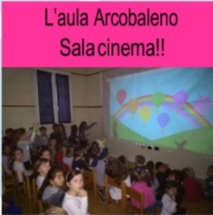
L'aula Arcobaleno Sala cinema!!