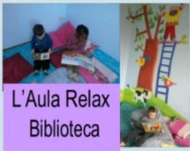
L'Aula Relax Biblioteca

L'ambiente e gli spazi sono accoglienti, curati, stimolanti, sicuri e a misura di bambino.